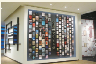
文学館エントランス書籍展示