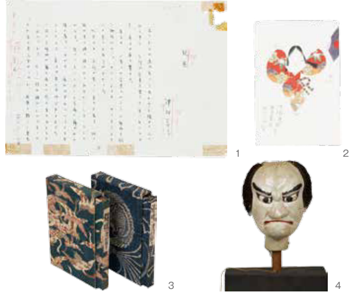
1 自筆原稿「玩具」(日本近代文学館蔵) 2 画家村上豊からの絵手紙(津村節子氏蔵) 3 愛用の着物で作った特別装丁本「海鳴」(津村節子氏蔵) 4 佐渡の文弥人形(福井県ふるさと文学館蔵)

尽きることのない探究心のもと、時代を超えて女性の心理と生き方を見つめ続けてきた津村の多彩な作品群を、自筆原稿や取材メモ、愛用品などを通して紹介します。