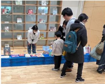
企画イベント 「本の交換会」