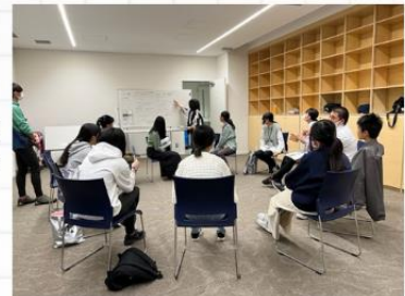
月1回の ミーティング