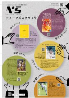
情報誌「ぺら」の執筆