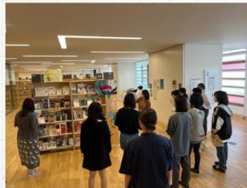
特集コーナー作成